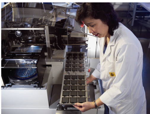
Mit Qualitätsmanagement zu zuverlässigen Prozessen

Die Sensirion AG will mit ihren Produkten und Leistungen höchsten Qualitätsansprüchen genügen. Aus diesem Grund ist das Schweizer Sensorikunternehmen bestrebt, sein Qualitätsmanagementsystem kontinuierlich zu verbessern und weiterzuentwickeln. Die im März 2008 erfolgte Zertifizierung nach der Norm ISO/TS16949:2002 bedeutet einen wesentlichen Meilenstein in diesem Prozess. Das Zertifikat erweitert die im Oktober 2003 erlangte Zertifizierung nach der Norm ISO 9001:2000 und belegt die erzielten Fortschritte im Qualitätsmanagement.